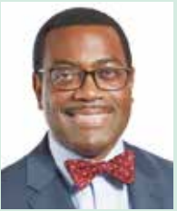
阿金吾米·阿迪希纳 (Akinwumi Adesina) 非洲开发银行集团行长

非洲开发银行于2013年4月制定了“长期战略2013~2022”。该战略构成了非洲开发银行集团推进转型的中心主体，旨在继续改善非洲的成长质量。根据该10年战略，阿迪希纳行长于2015年9月提出了新的方针。该方针将①照亮非洲、②实现非洲粮食供给、③工业化非洲、④非洲一体化、⑤提高非洲人民生活质量这5个领域作为优先进行开发的领域，将其称作“High 5s” (五优)。